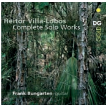
Heitor Villa-Lobos: Sämtliche Werke für Gitarre MDG 905 1629-6 (Hybrid-SACD)