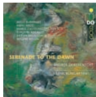
MDG 905 1540-6 (Hybrid-SACD)

Exzessive in den Etüden – das ist wunderbar und einzigartig.