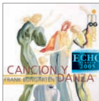
MDG 305 1246-2